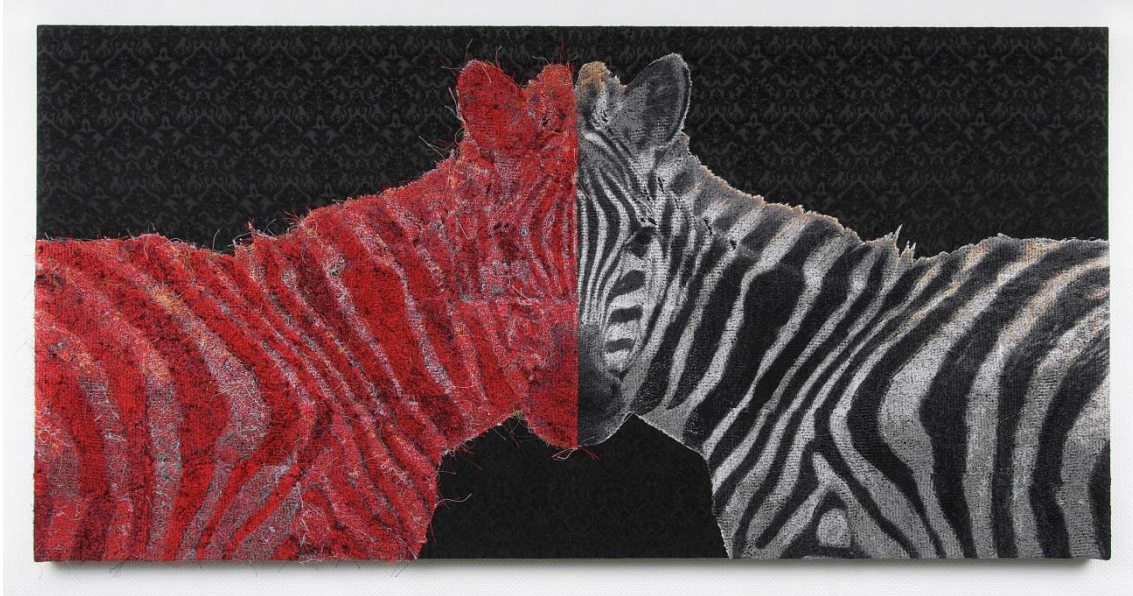
宮田彩加「しままの形態と対称性」 2014年、ミシン糸、綿布・パネル、52×105×3cm

Email: info@makifinearts.com Tel : +81-(0)3-6806-0615