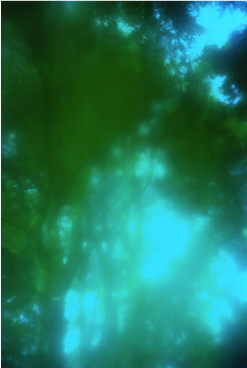
田中和人「GOLD SEES BLUE」 2010年、pigment print