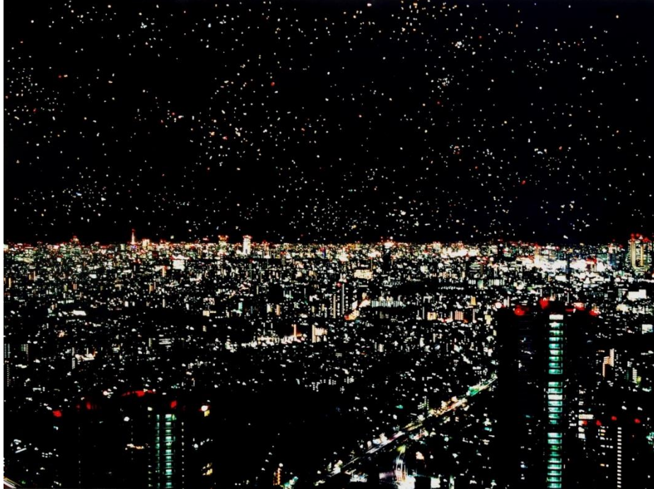
Shu Ikeda "Invisible Background"

2015, photographic collage, mounted on aluminium, 790×1040mm