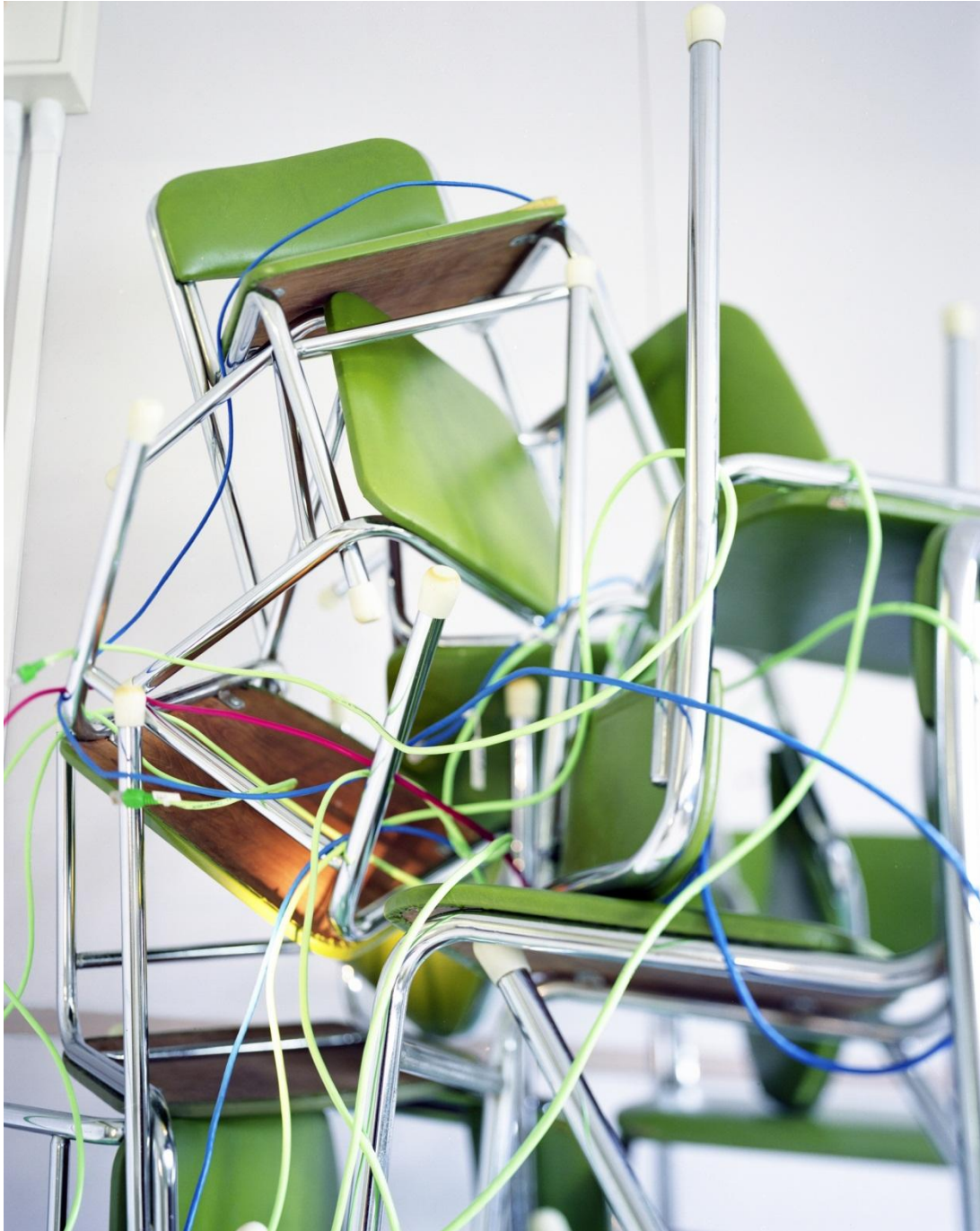
田中和人/Tanaka Kazuhito "Untitled Composition" 2010-11年、color photograph

Email: info@makifinearts.com Tel&Fax : +81-(0)3-3669-7501